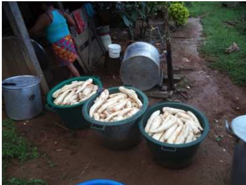
Figure 9. Préparation du cachiri à Camopi. Auteur : participante de Camopi

Les fêtes de cachiri, les fêtes en général, par exemple sur la place du fromager de Camopi, les activités collectives de manière générale, sont ressorties comme des déterminants importants du bien-être (Figure 9).