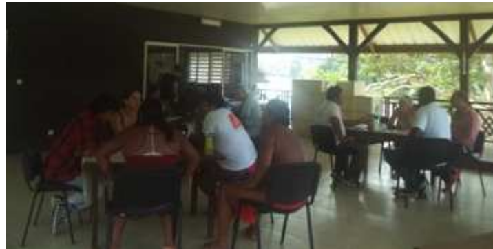
Figure 4. World Café à la Mairie de Camopi

Les personnes présentes ont ensuite été réparties par table et ont circulé de table en table afin de mobiliser la discussion, de faire émerger leurs perspectives et faire apparaître des solutions non encore mises à jour par les habitants (Figure 4).