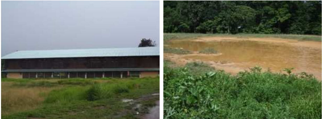
Figure 7. A gauche, le hall sportif de Camopi. A droite : le terrain de football de Village Zidoc, Trois Sauts. Auteurs : jeunes de Camopi et Trois Sauts

PINTO-TAVARES Nina, 26 ans, Ile du Diable, Wayampi