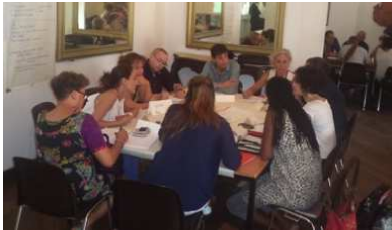
Figure 5. Table de réflexion « Santé » lors de l'événement de restitution participative à la Préfecture de Cayenne

Les principaux thèmes et solutions qui ont émergé du diagnostic ont été divisés entre ces trois groupes de travail, afin de générer un débat et des solutions entendues et soutenues par les institutions présentes (Figure 5, Table 3).