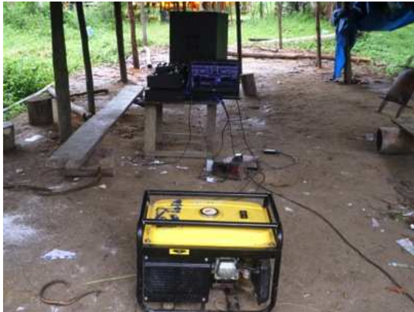
Figure 11. L'accès aux TICs à Trois Sauts, déterminant du bien-être. Auteur : participant de Trois Sauts.

Ces thèmes sont intimement liés les uns aux autres et l'état de l'une de ces catégories peut avoir une influence forte sur l'état des autres. Ainsi, dans le cadre de développement d'un programme ou projet, il est fortement recommandé de prendre en compte l'ensemble de ces éléments, de manière simultanée si possible.