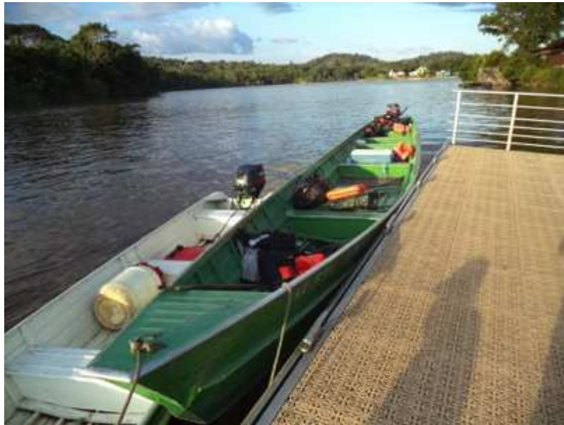
Figure 10. La pirogue de voyage, source de bien-être.

déplacer sur le fleuve pour se rendre aux bourgs ou en ville est un besoin essentiel (Figure 10). Ceci est notamment possible grâce aux économies faites par les familles pour acheter des pirogues, moteurs et essence, mais aussi grâce à l'entre-aide, grâce aux taxis-pirogues, et grâce au transport scolaire, qui sont tous apparus comme source de bien-être. Il est apparu essentiel que, dans tout programme ou projet lancé sur ce territoire, soit systématiquement intégrée une composante d'échange et de voyage, pour répondre aux besoins de voyage qui émane des jeunes.