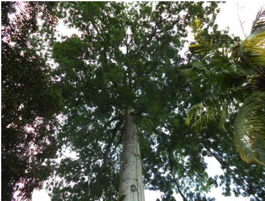
Le fromager de la place de Camopi