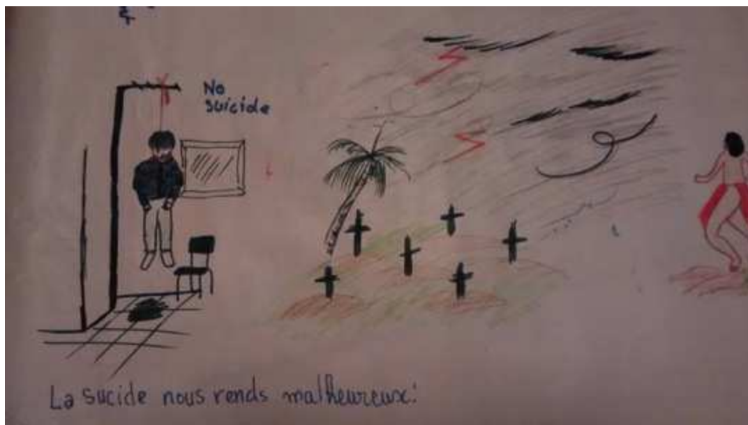
Figure 16. "Le suicide nous rend malheureux": dessin réalisé par un collégien de St Georges originaire de Trois Sauts.

Il ne peut donc pas y avoir une réponse unique à la prévention des comportements suicidaires. Un message fort transmis par le personnel du Centre de Santé de Camopi insiste sur le fait que le mal-être qui pousse aux actes suicidaires émane selon eux d'un sentiment d'abandon qui ne peut être résolu que par un engagement politique puissant pour la reconnaissance officielle de la spécificité géographique et culturelle de ce territoire , un investissement significatif pour la décentralisation des services publics, y compris scolaires, et un véritable engagement pour le soutien des initiatives locales. Le personnel de santé semble insister sur le fait que les approches psychiatriques sont importantes, mais ne peuvent faire l'économie d'approches sur les déterminants du bien-être et du mal-être mentionnés plus haut.