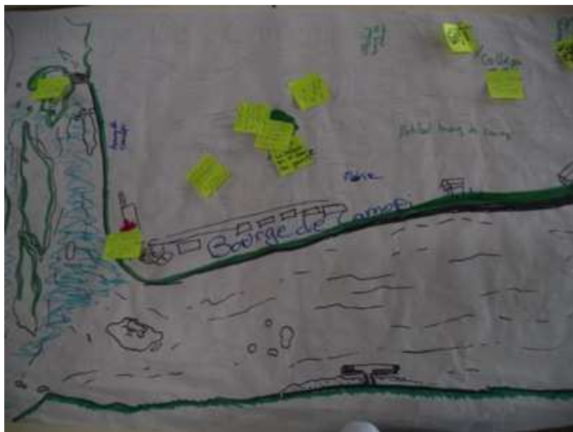
Figure 3. Cartographie participative pour identifier les lieux de bien-être et mal-être à Camopi

Toutefois, les moyens et le temps impartis dans le cadre d'un diagnostic ne sont pas suffisants pour s'engager dans un processus de photo participative approfondi. Par ailleurs, si ces méthodes sont souvent mobilisatrices pour les participants plus jeunes, les participants les plus âgés préfèrent une simple conversation. Ainsi, d'autres méthodes de participation ont été utilisées pour s'adapter au public et au contexte :